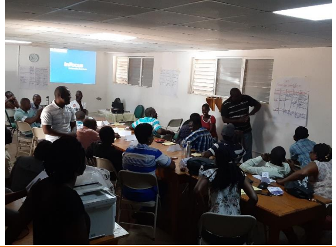
Formation interne sur la Gestion des Risques et Désastres au niveau d'ADEMA