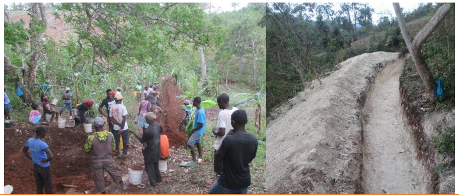
Mise en place de digue en terre battue à Zabette / localité de la 3 ème section communale Baie-de-Henne (Voir l'article de la page 2) dans le cadre du projet R2D2 financé par l'Agence Française de Développement