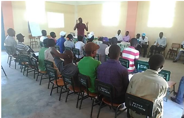
Formation EDAB pour les membres EIC de Baie-de-Henne dans le cadre du projet R2D2 financé par l'AFD