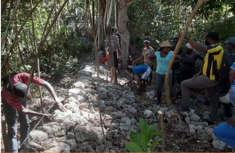
Traitement des ravines : Mise en place de seuils à la première section communale de Bombardopolis (En partenariat avec HI).