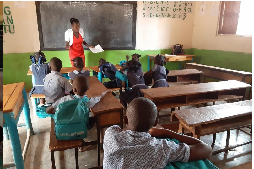
Mise en place de classe de remédiation pour les enfants en échec scolaire à Bombardopolis et à Jean Rabel